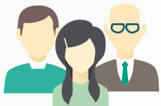
Masyarakat, Penduduk, Bisnis, Warga Asing

Pendaftaran bisnis Pengajuan pajak Permohonan perijinan Permohonan hibah Permohonan perumahan Pendaftaran pendidikan Permohonan kesejahteraan Penegakan hukum Dokumen perjalanan Umpan balik & keluhan Penjangkauan